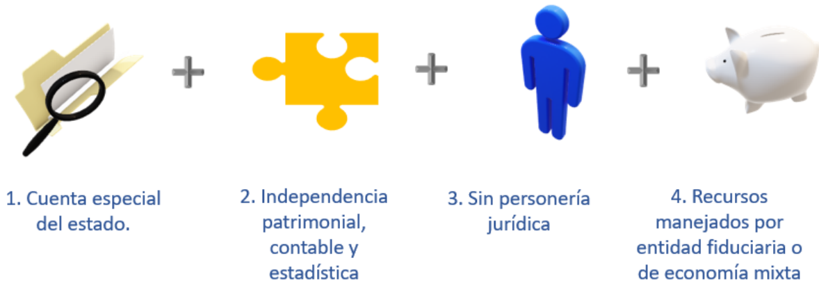
Gráfico 1. Estructura del FOMAG