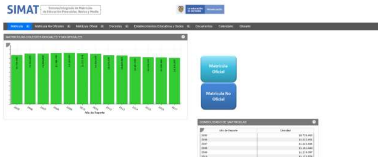
Ilustración 1. Estadísticas sectoriales – Pagina Web MEN

http://bi.mineduacion.gov.co:8380/eportal/web/planeacion-basica