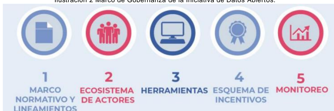
Ilustración 2 Marco de Gobernanza de la Iniciativa de Datos Abiertos.

confianza entre el estado y el ciudadano, favoreciendo la liberación de datos, un mejor acceso a los mismos, mayor intercambio, y finalmente su reutilización e impacto. En Colombia este marco de Gobernanza se compone de 5 elementos clave: